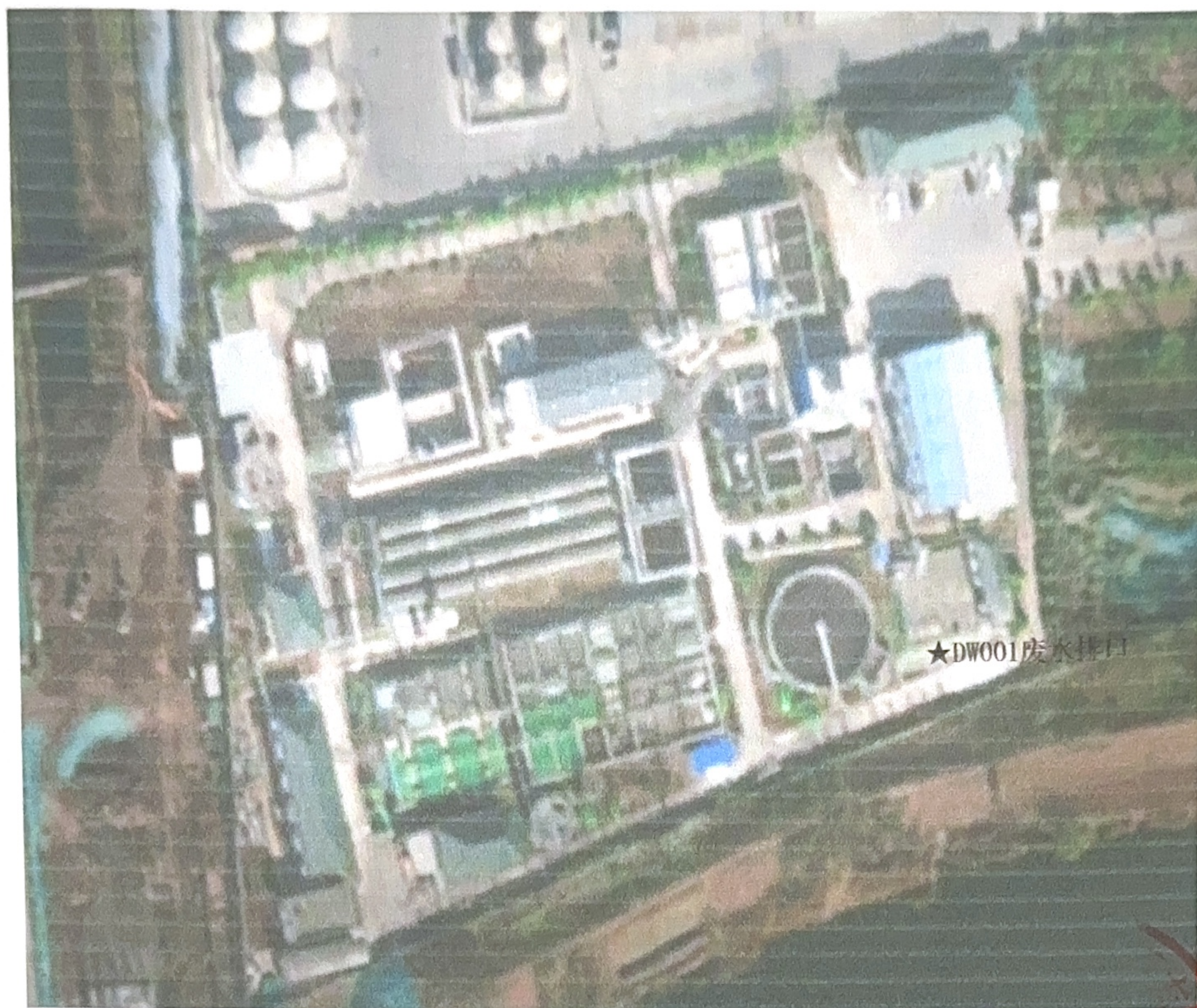
附图1 检测点位示意图