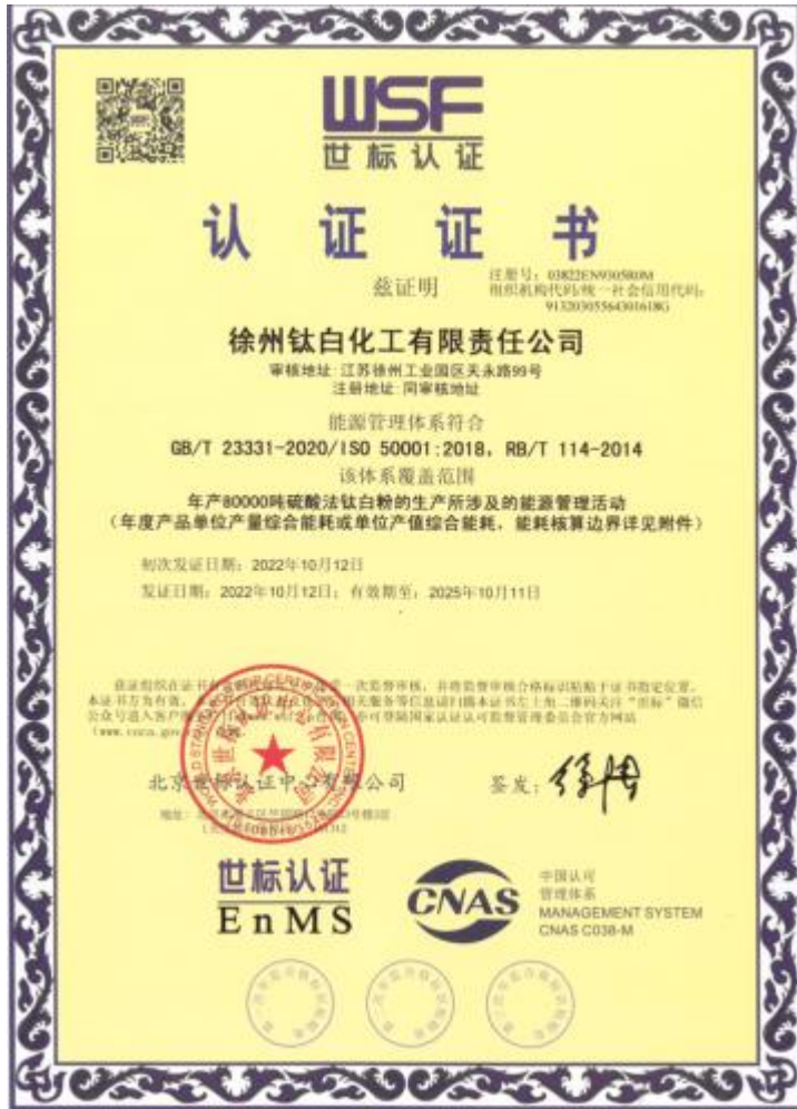
公司各体系认证证书